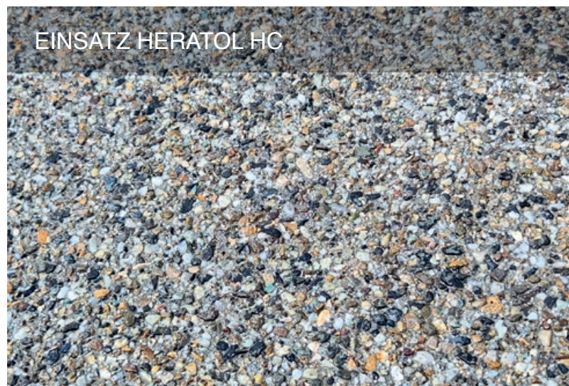
EINSATZ HERATOL HC