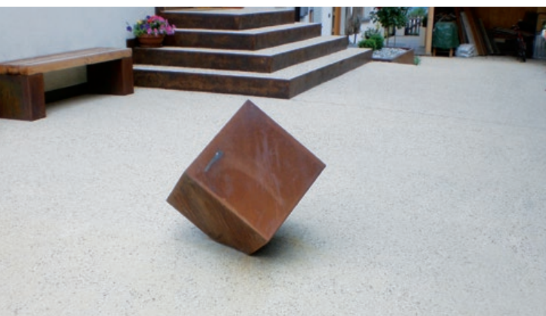
EINSATZ HERATOL HC